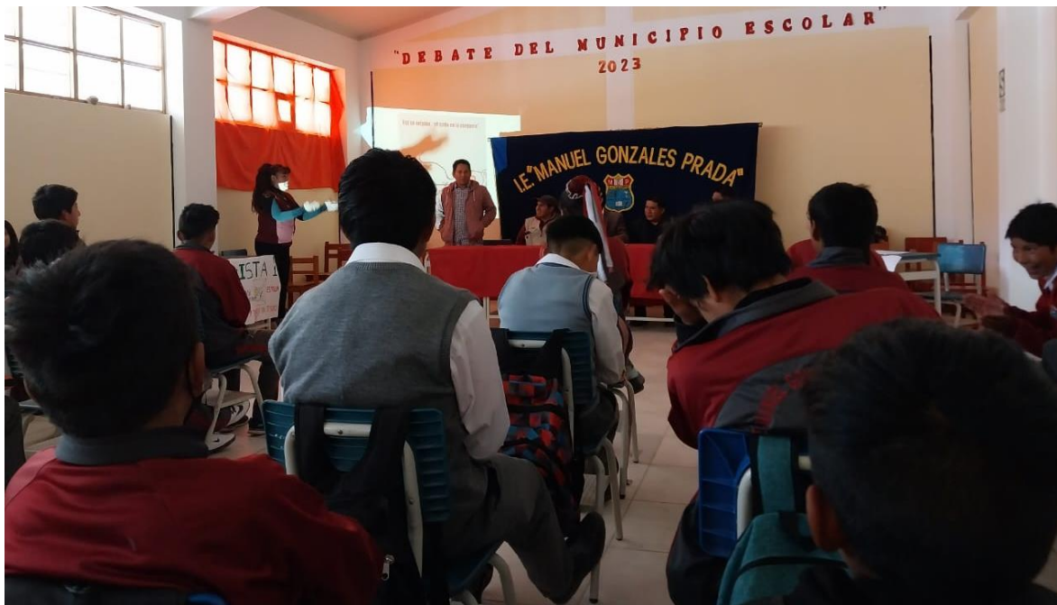
Foto en la ejecución de la apertura del taller “FORTALECIMIENTO EN HABILIDADES SOCIALES COMPAÑERISMO, RESPETO, SOLIDARIDAD Y EMPATÍA” realizado el 14 de noviembre del año en curso dirigido a los estudiantes de la Institución Educativa Manuel Gonzales Prada.

Foto en la ejecución de la apertura del taller “FORTALECIMIENTO EN HABILIDADES SOCIALES PARA LA CONVIVENCIA LIBRE DE VIOLENCIA EN LA IE” realizado el 14 de noviembre del año en curso dirigido a los estudiantes de la Institución Educativa Manuel Gonzales Prada.