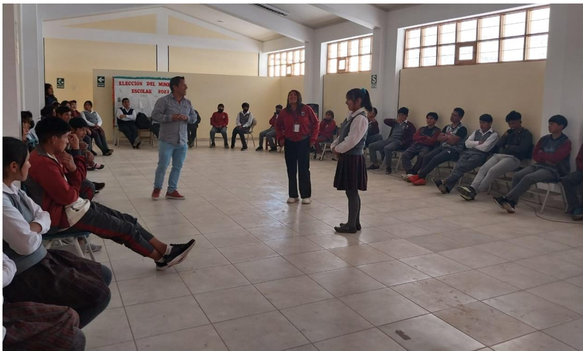
Foto en la ejecución de la apertura del taller “FORTALECIMIENTO EN HABILIDADES SOCIALES CONSECUENCIAS LEGALES DE LOS TOCAMIENTOS INDEBIDOS” realizado el 14 de noviembre del año en curso dirigido a los estudiantes de la Institución Educativa Manuel Gonzales Prada.

Foto en la ejecución de la apertura del taller “FORTALECIMIENTO EN HABILIDADES SOCIALES DEBERES Y DERECHOS DE LOS NIÑOS NIÑAS Y ADOLESCENTES ” realizado el 14 de noviembre del año en curso dirigido a los estudiantes de la Institución Educativa Manuel Gonzales Prada.